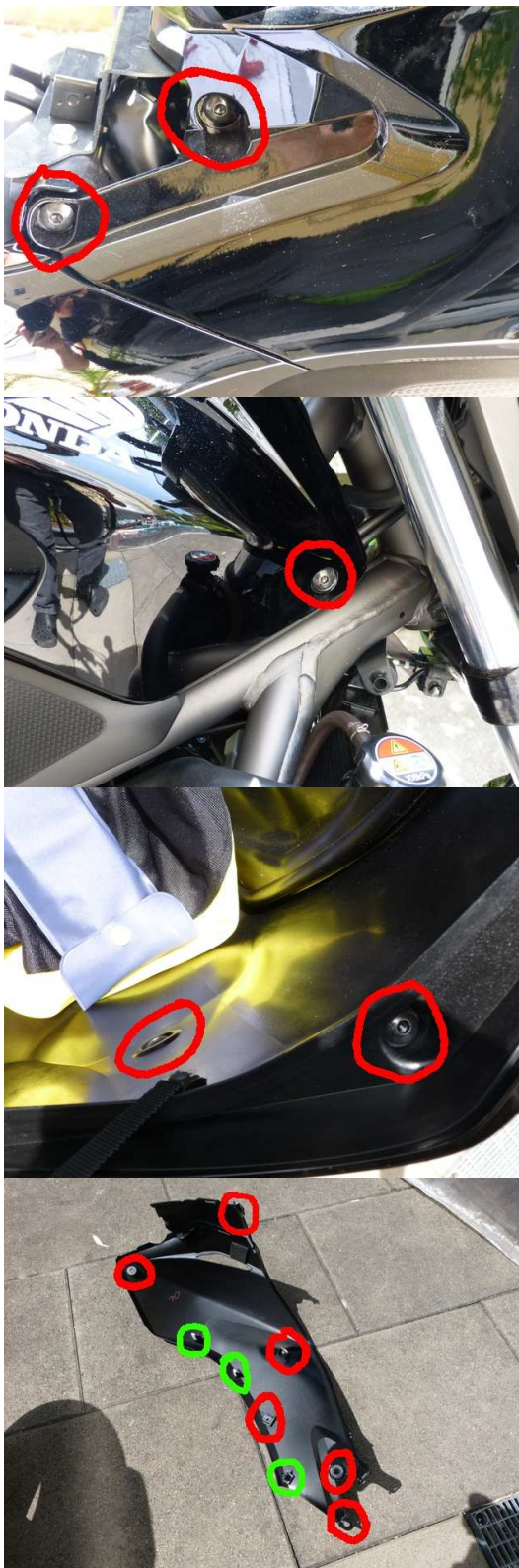
Grün sind hier die Steckverbindungen.